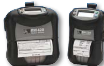
Imprimantes de la gamme RW

©2009 ZIH Corp. Z-Perfom, Z-Select, ZebraCare et tous les noms et références de produits cités sont des marques commerciales de Zebra, et Zebra, la représentation de la tête de zèbre sont des marques déposées de ZIH Corp. Tous droits réservés. Bluetooth est une marque déposée de Bluetooth SIG, Inc. Toutes les autres marques citées dans ce document appartiennent à leurs propriétaires respectifs.