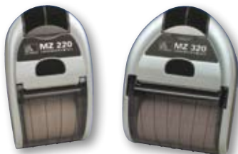
Imprimantes de la gamme MZ